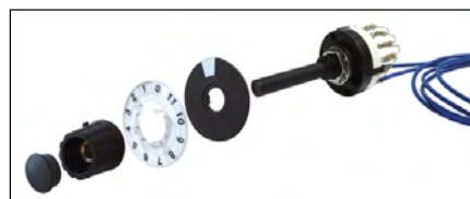
Commutatore per selezione 12 gruppi da 5 setpoint. Selector switch for 12 groups selection by 5 setpoint.