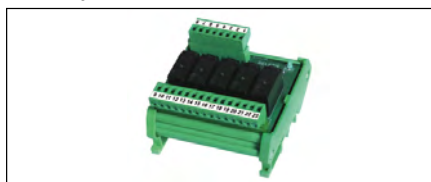
Modulo 5-relé esterno per aumentare la portata dei contatti di scambio a 2A/115Vac. External 5-relay module to increase the capacity of SPDT contacts to 2A/115Vac.