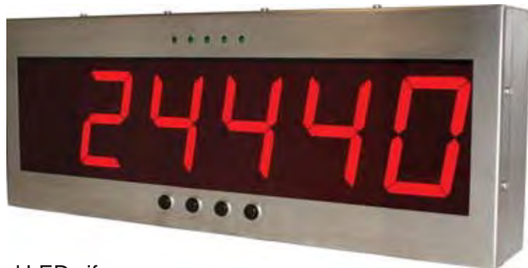
100mm med LED cifre