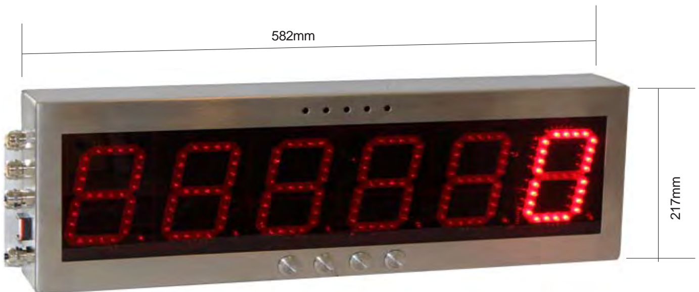
100mm udendørs model med LED punkt cifre, IP65