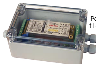
IP65 plast boks kan leveres til alle typerne