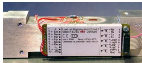
LDU68.1 monteret direkte på en vejecelle

High speed vejning, 2400 konverteringer sek. RS422/485 fuld duplex, 2 logiske input og 2 logiske output. EN45.501 5000e godkendt ( R76 & R51 ) +/- 260.000 delinger internt